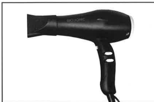
MODEL GoldPro™ 1875W SPEED DRYER – 220V

Děkujeme Vám za zakoupení Bio Ionic GoldPro™ 1875W SPEED DRYER.